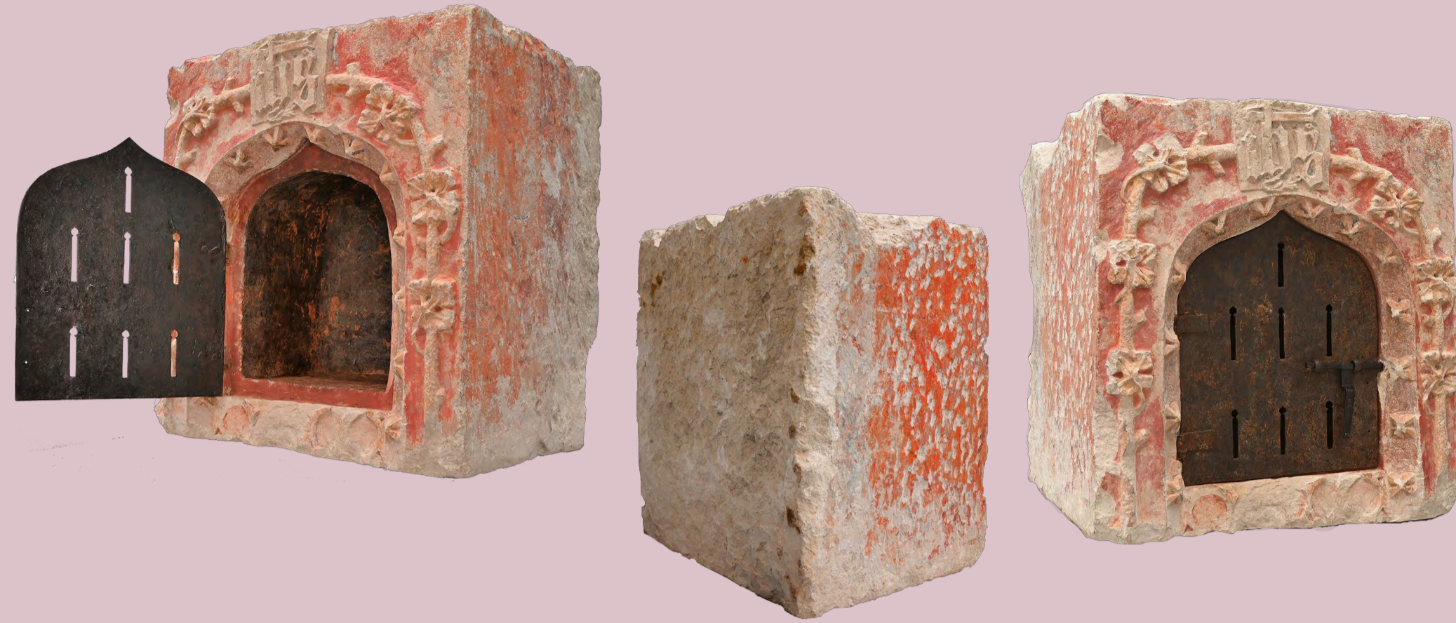
Sagrario zaharberitua / Sagrario restaurado